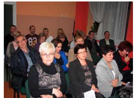
Debata o bezpieczeństwie zainteresowała wielu mieszkańców

Uczestnicy debaty wyrazili wolę organizowania kolejnych spotkań, których celem powinno być szeroko pojęte bezpieczeństwo w gminie.