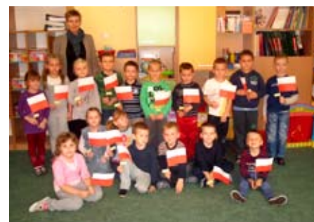
Dzieci z oddziału przedszkolnego w Przyjmiu z polskimi flagami

Grudzień to tradycyjnie okres, w którym przypomina się tradycje związane ze Świętami Bożego Narodzenia. Biblioteka Publiczna w Golinie organizuje zajęcia o tematyce świątecznej, m.in. robienie kartek świątecznych, witraży i ozdób choinkowych, przy wykorzystaniu różnych technik.