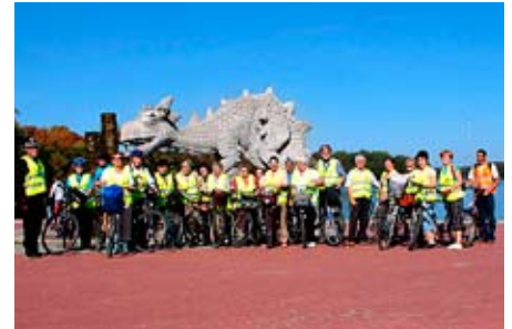
Ostatni rajd 2011

W tegorocznych jedenastu rajdach uczestniczyło 459 osób. Przejechalśmy 512 km. sp