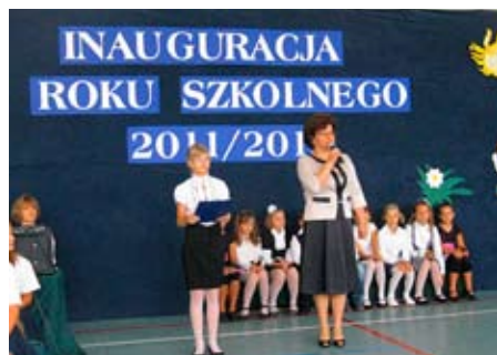
Inauguracja roku szkolnego