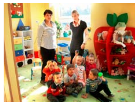
Przedszkolaki z Radoliny podczas zajęć