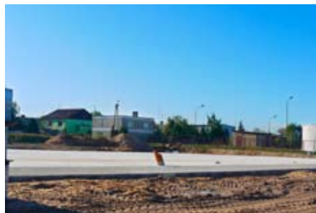
Podłoże przygotowane do powierzchni poliuretanowej (kompleks Orlik)