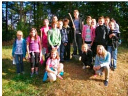
Złota Góra zdobyta

Kasztanowców. W Węglewskich Holendrach zobaczyli dawny cmentarz ewangelicki. W Kolnie uczestniczyli w zajęciach edukacyjnych i zjedli smaczny posiłek przygotowany przez rodziców. Natomiast 29 września