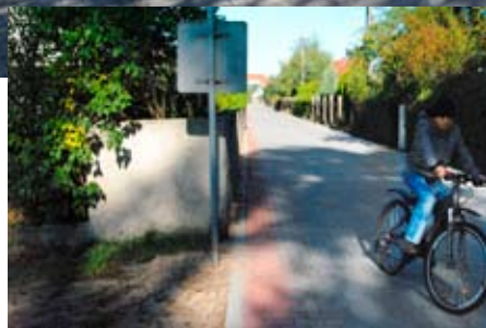
Nowo oddana ulica Parkowa