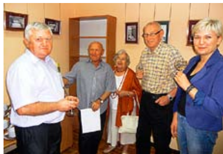
Gospodyn i goście wernisażu

Ukończył Akademię Ekonomiczną w Poznaniu. Debiutował jako poeta w 1971 roku na łamach czasopisma „Radar”. Od 1967 był pracownikiem Huty Aluminium „Konin”.