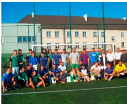
Uczestnicy Ligi „6” (grupowe)