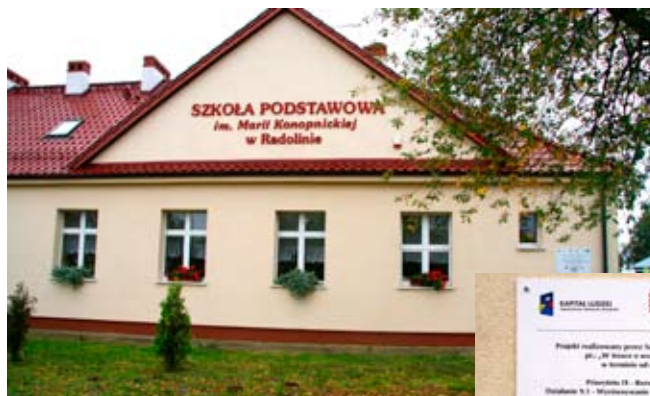
Szkoła Podstawowa w Radolinie

Program przewiduje diagnozę psychologiczną, pedagogiczną, logopedyczną, rehabilitacyjną w celu stwierdzenia dysfunkcji u dzieci. Dzieci wymagające wsparcia specjalistycznego będą miały możliwość uczestniczenia w zajęciach terapeutycznych.