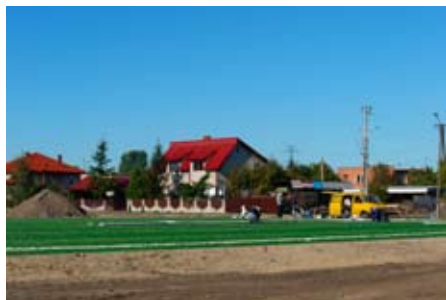
Boisko ze sztuczną trawą (kompleks Orlik)

Ruszyła budowa ulicy Cmentarnej w Golinie ( I etap) oraz budowa drogi w miejscowości Rosocha.