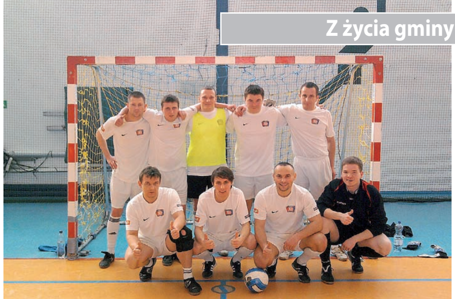
W Kazimierzu Biskupim wygrał powiat koniński, reprezentowany przez gminę Golina.