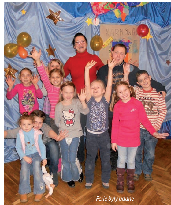
Ferie były udane

W czasie ferii Dom Kultury w Golinie pod swój gościnny dach przyjął również podopiecznych Fundacji im. Dr Piotra Janaszka „Podaj dalej”, umożliwiając tym samym realizację zajęć w ramach projektu: „Niepełnosprawny Może Więcej!” Bo może.