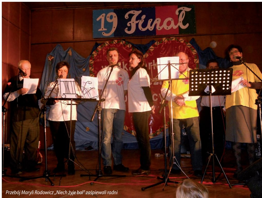
Przebój Maryli Rodowicz „Niech żyje bal” zaśpiewali radni

przekraczając granicę 10 tys. zł i bijąc kolejny rekord! Tegoroczny finał został zorganizowany na rzecz dzieci z chorobami urologicznymi i nefrologicznymi. Z każdym rokiem udaje się zebrać coraz większą kwotę, co napawa optymizmem i pozwala wierzyć, iż orkiestra Jurka Owsiaka naprawdę będzie grała do końca świata i o jeden dzień dłużej.