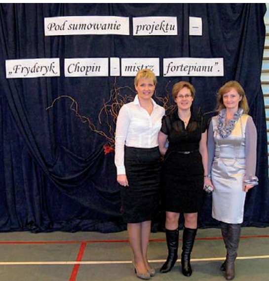
Organizatorki projektu „Fryderyk Chopin - mistrz fortepianu”

Poniżej prezentujemy ostatnie wydania związane ze Szkołą Podstawową im. Juliusza Słowackiego w Golinie. Placówka realizowała ciekawe projekty, m.in. związane z 200. rocznicą urodzin Fryderyka Chopina.