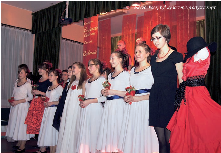
Wieczór Poezji był wydarzeniem artystycznym