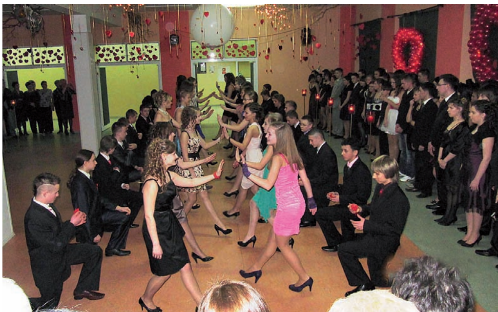
Nie zabrakło poloneza

Gimnazjum w Golinie znalazło się na ogólnopolskiej mapie Szkół Odkrywców Talentów