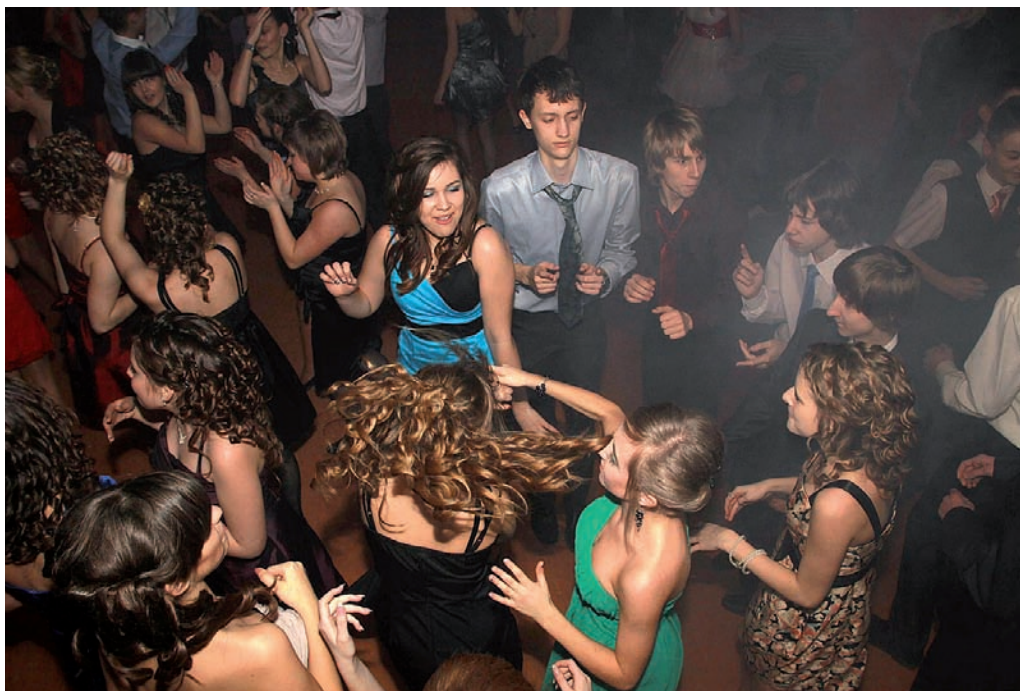
Bal został zgodnie uznany przez uczniów za naprawdę udany