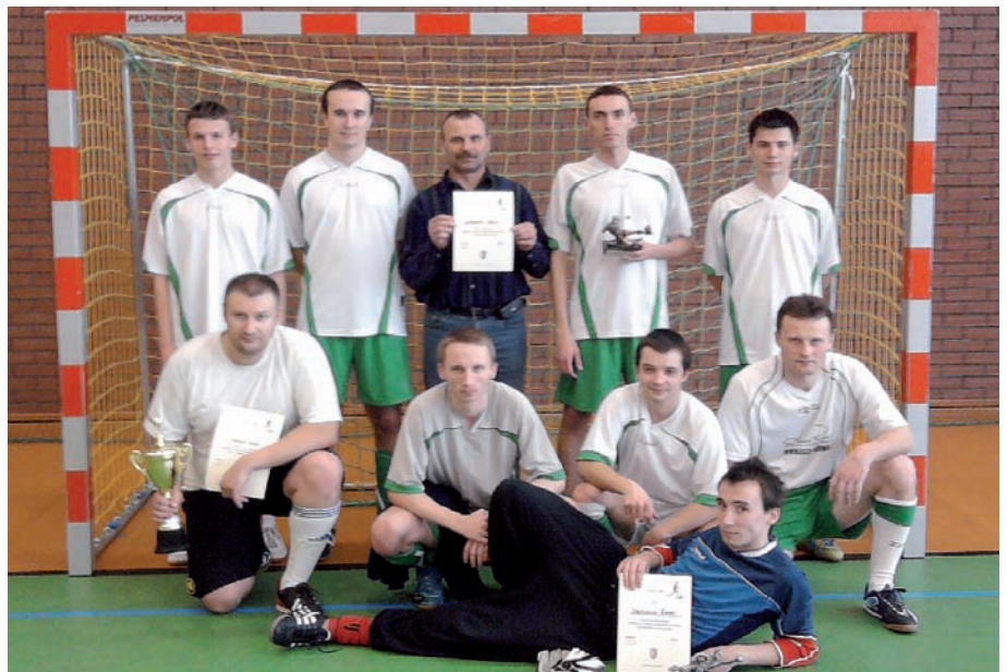
W Gminnym Turnieju Halowej Piłki Nożnej o Puchar Burmistrza Gminy najlepszy okazał się Herkules Golina