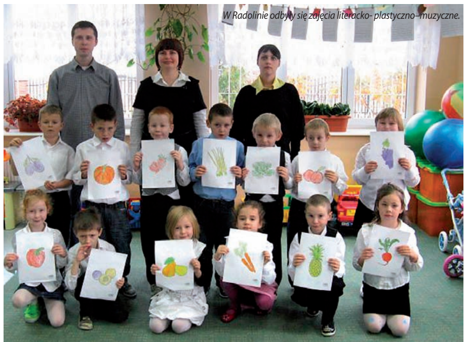
W Radolinie odbyły się zajęcia literacko- plastyczno-muzyczne.

Biblioteka serdecznie dziękuje Agnieszce Waliniak za możliwość przeprowadzenia zajęć.