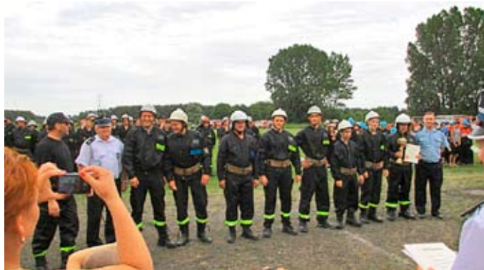
OSP Sławie - seniorzy