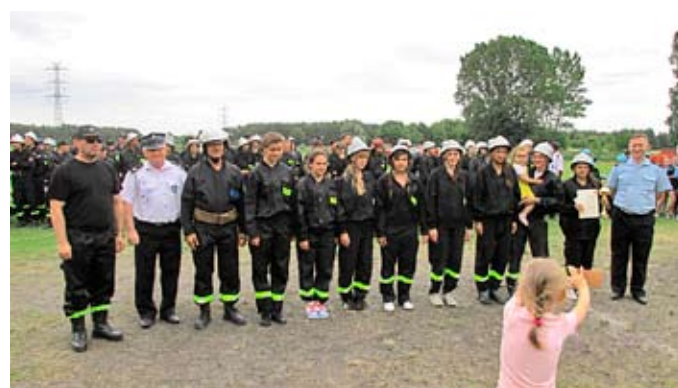
OSP Sławie - kobiety