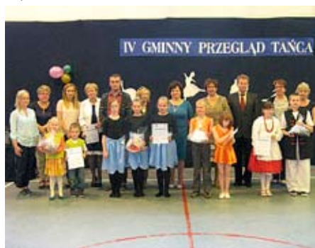
IV Gminny Przegląd Tańca