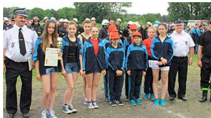
OSP Radolina - dziewczęta