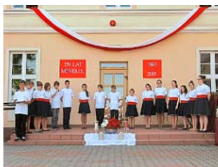
Apel z okazji 150. rocznicy wybuchu Powstania Styczniowego

słem organizacyjnym apel był zasługą współpracujących z sobą grup uczniów, nauczycieli i pracowników obsługi.