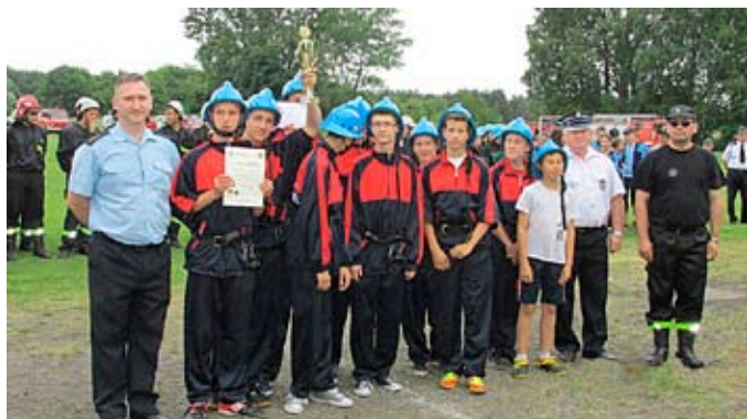
OSP Myślubórz – chłopcy