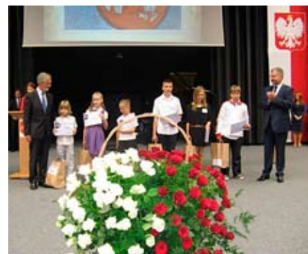
Nagrodzeni w konkursach o Powstaniu Styczniowym