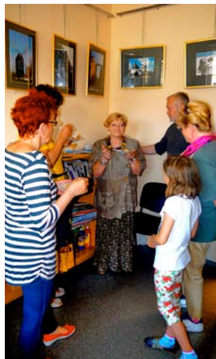
Na wernisażu była także Maja Piórska, autorka zdjęć.