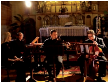
Zwieńczeniem sympozjum był koncert w wykonaniu Accademia dell'Arcadia