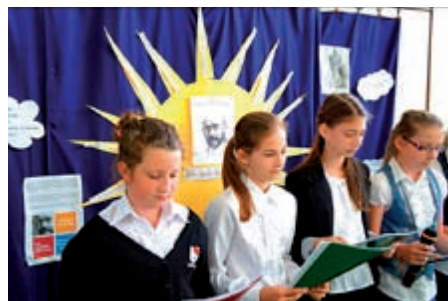
Szkoła w Kawnicach włączyła się w obchody Roku Janusza Korczaka

Szkoła Podstawowa im. Stanisława Wyspiańskiego w Kawnicach włączyła się w obchody Roku Janusza Korczaka. Dzięki materiałom przygotowanym przez nauczycieli i ciekawym