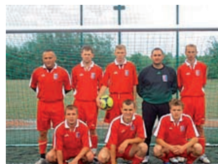
Drużyna piłki nożnej