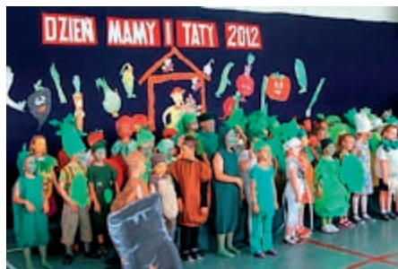
Dzień Mamy i Taty