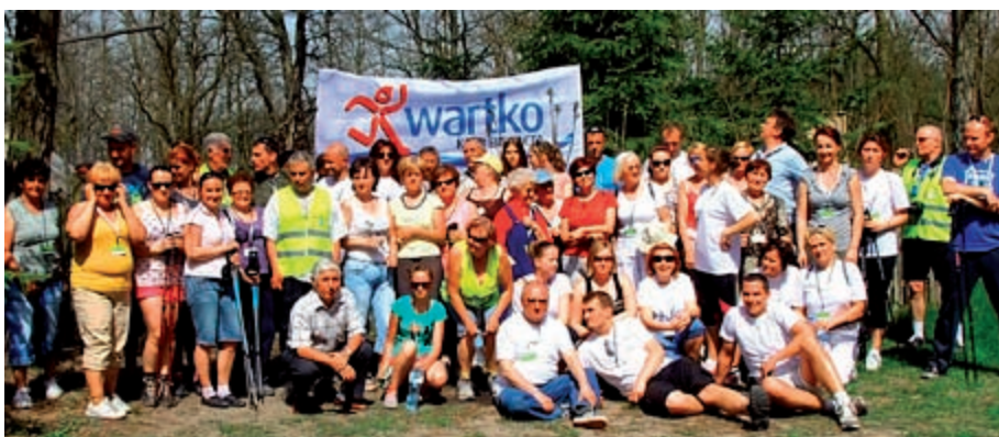
Słoneczny Rajd Nordic Walking cieszył się dużym zainteresowaniem

Organizując rajd KB Wartko włączył się w obchody 650-lecia lokacji miasta. Klub zaprasza do uczestniczenia w innych sportowych imprezach w naszym rejonie.