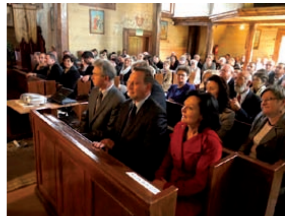
W kościele pw. św. Jakuba odbyła się sesja popularnonaukowa pt. „Golina przez wieki”