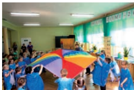
Dzieci ze Szkoły Podstawowej w Przyjmie w ramach jednego z projektów dowiedzieli się, co mogą zrobić dla ochrony środowiska

sza była SP Przyjma. II miejsce zajęła SP Golina, III - SP Radolina, IV - SP Kawnice. Natomiast w kategorii klas IV-VI kolejność była następująca: I miejsce - SP Przyjma, II - SP Radolina, III - SP Golina, IV - SP Kawnice.