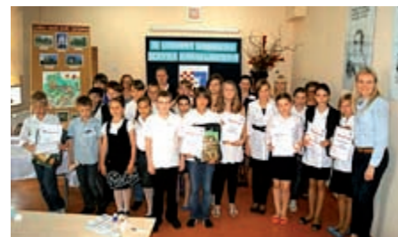
II Gminny Konkurs Języka Angielskiego