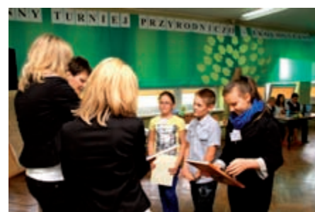
Szkoła była gospodarzem Gminnego Turnieju Przyrodniczo-Ekologicznego

Elementem projektu były również wycieczki do Kotliny Kłodzkiej oraz do Centrum Nauki Kopernik w Warszawie.