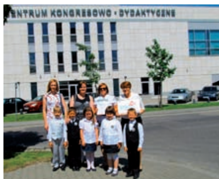
W uroczystej gali w Poznaniu uczestniczyła 9-osobowa delegacja ze Szkoły Podstawowej w Radolinie Konopnickiej w Radolinie

Oprócz tabliczek pamiątkowych dla wszystkich uczestników konkursu wręczanych dyrektorom szkół przez podsekretarza stanu w Mi-