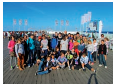
Uczestnicy wycieczki do Malborka, Gdańska, Sopotu i Gdyni

Uczniowie z Kółka Przyrodniczo-Ekologicznego przybliżyli koleżankom i kolegom problemy z jakimi „boryka się obecnie Ziemia”. Z okazji Dnia Ziemi zaprosili wszystkich uczniów szkoły na przedstawienie, którego autorką była Aneta Karmowska-Gałęzka. Doskonały scenariusz i świetna gra młodych aktorów pozwoliły na refleksję nad własnym postępowaniem. Należy sobie uświadomić, jak wiele zależy od każdego z nas i co musimy robić, aby chronić Ziemię.