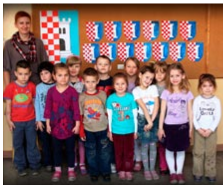
650-lecie Golinie to okazja do przypomnienia, że każdy ma obowiązki wobec Małej Ojczyzny

W styczniu w Szkole Podstawowej w Przyjmiu przy współudziale SP, Rady Rodziców oraz miejscowej OSP została zorganizowana choinka szkolna. Uroczystość rozpoczęła się występami przygotowanymi przez nauczycieli oraz uczniów. Teatrzyk „Biedroneczki” pod