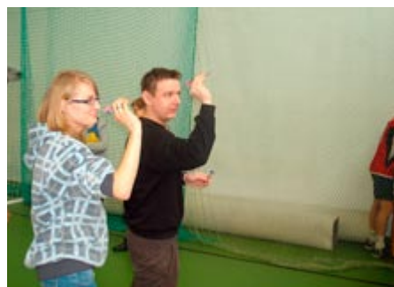
Reprezentantka gminy Golina rzucała lotką do tarczy