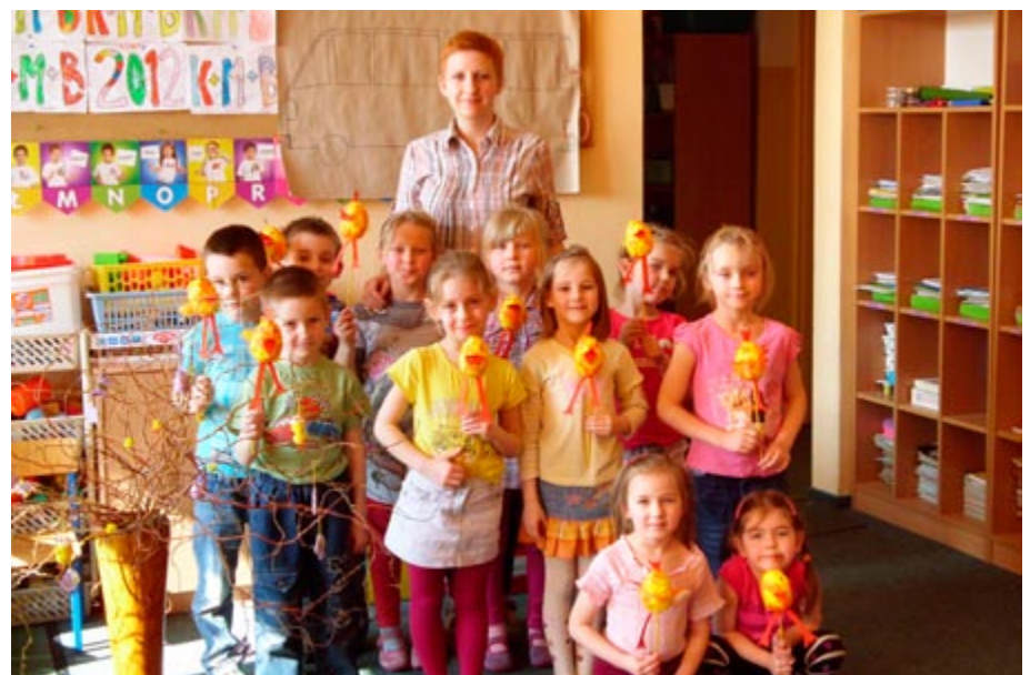
Dzieci wykonały kolorowe kurczaczki