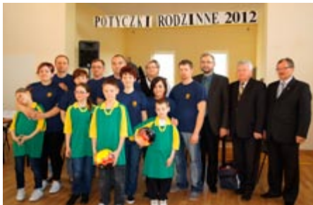
W Potyczkach Rodzinnych rywalizowały reprezentanci wsi Przyjma i Lubiecz