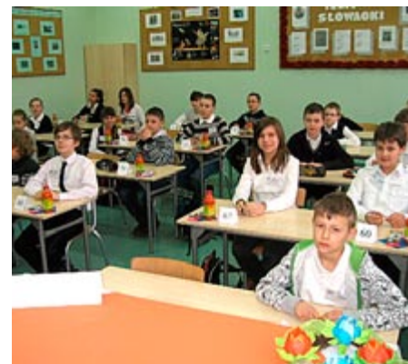
Uczestnicy Konkursu Wiedzy o Wielkopolsce.