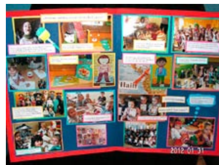
Uczniowie ze szkoły w Kawnicach poznali Haiti, kraj Ameryki Środkowej

Basia - to bohaterka książek wydawnictwa Egmont. W tym roku, na podstawie opowiadania „Basia i kolega z Haiti”, dzieci poznały kolegę Basi - Titiego. Każdy dzień dostarczał nowych informacji o kraju Ameryki Środkowej. Wszyscy bawili się na haitańskim balu. Zadaniem przedszkolaków było wcielenie się w rolę dzieci z różnych części świata.