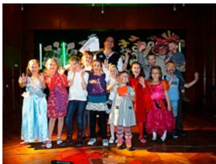
Dzieci biorące udział w zajęciach w Domu Kultury pewnie czują się na scenie

Dom Kultury zaoferował także zajęcia mu-