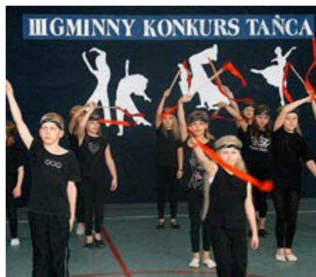
W III Gminnym Konkursie Tańca wystartowało 5 zespołów